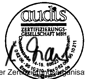
Leiter Zertifizierung Organisation